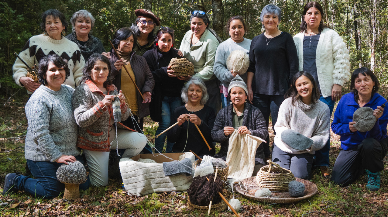
ARTESANAS DEL BOSQUE Parque Nacional Alerce Andino